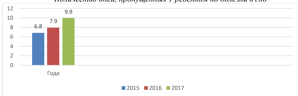
Мониторинг состояния здоровья детей ДОУ (выборочный)